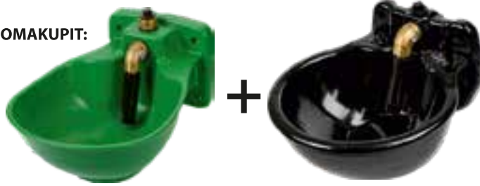
JUOMAKUPPI HP20 2 kpl (teho 31 W)

Käytä aina lämmitettävien kuppien ja altaiden asennuksessa valtuutettua sähköalan ammattilaista.